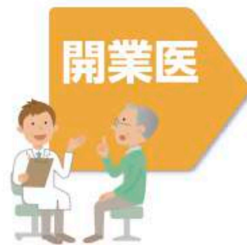
保険金額と保険料

医療事故に備えて「医師賠償責任保険」の団体扱いを行っています。団体割引適用のため個人で加入するより保険料を抑えられます。